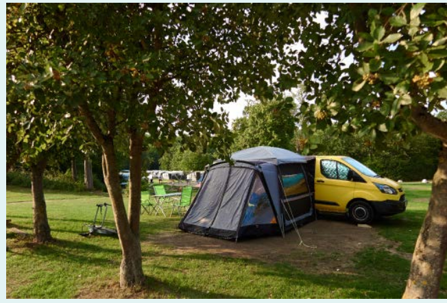
↑ Camping Nivå

2 Nivå Camping adres Solyst Alle 14, DK-2990 Nivå i nivaacamping.dk open van 1 april tot 1 oktober terrein 4,5 ha met 200 toeristische en 40 vaste staanplaatsen. 22 huuraccommodaties Camping Nivå ligt op 35 kilometer van Kopenhagen in een unieke, maritieme omgeving met veel natuur, cultuur en historie. De camping is omgeven door een groot bos en een