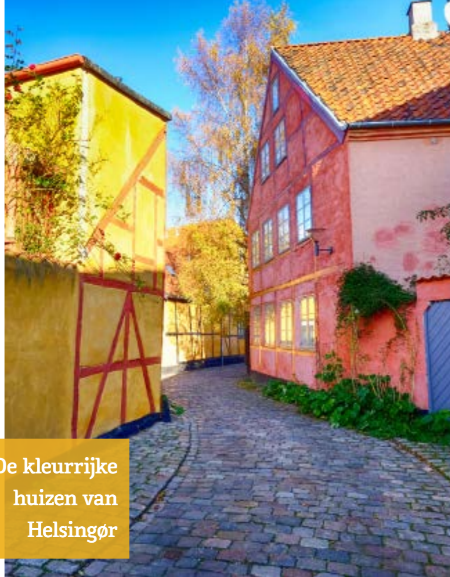
De kleurrijke huizen van Helsingør